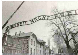
Eingang des KZ Auschwitz.

1935 befahl Hitler die Rassentrennung an den Schulen, Heiraten zwischen